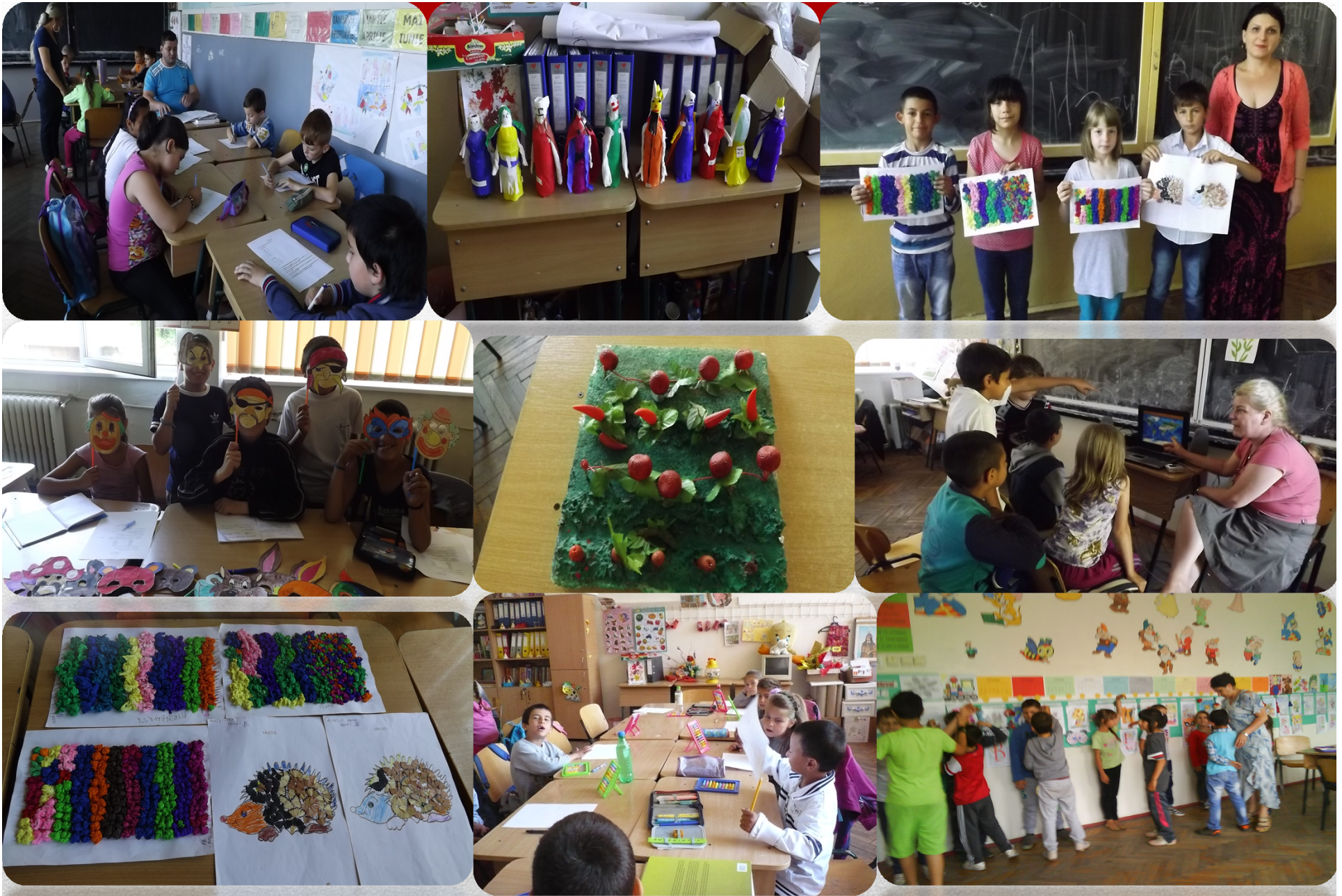
Activități de tip “Școala de vară”