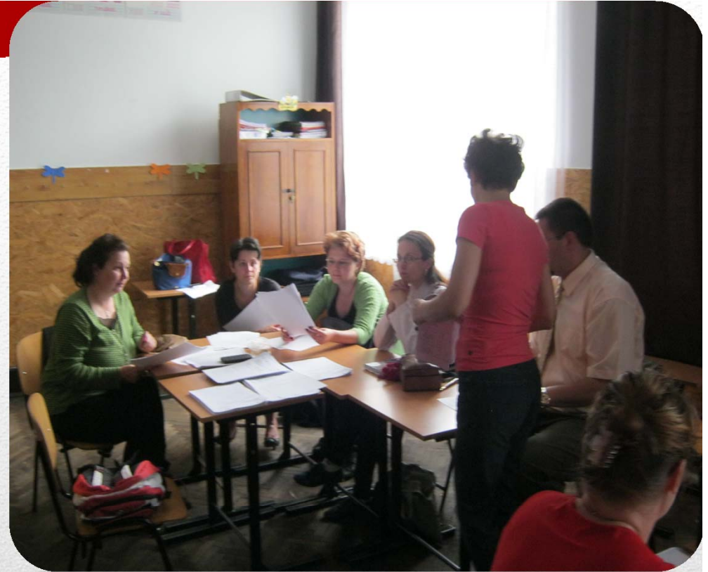
Școala Gimnazială Nr 3 Lupeni