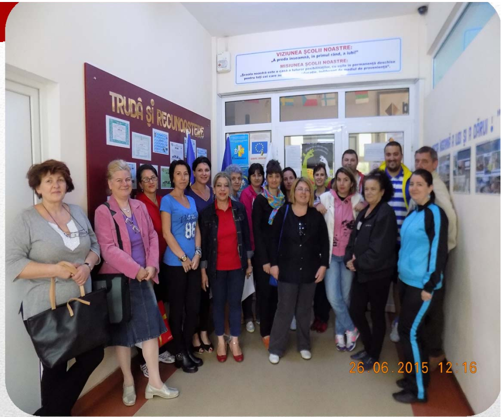
Școala Gimnazială Nr.7 Petroșani