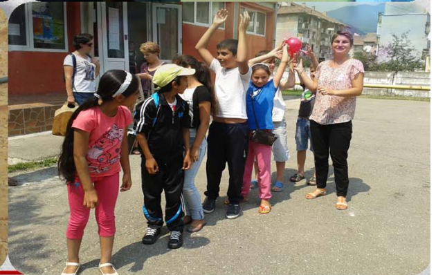
Activități de tip “Școala de vară”