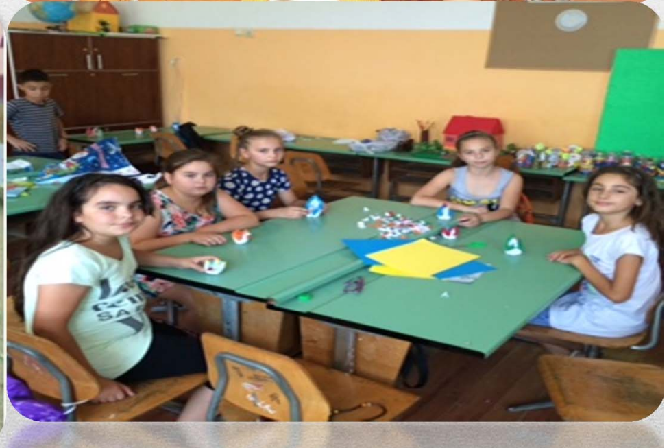
Activități de tip “Școala de vară”