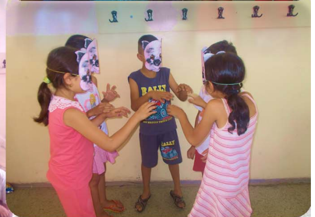
Activități de tip “Școala de vară”