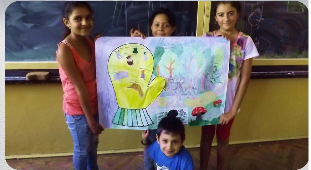
Activități de tip “Școala de vară”