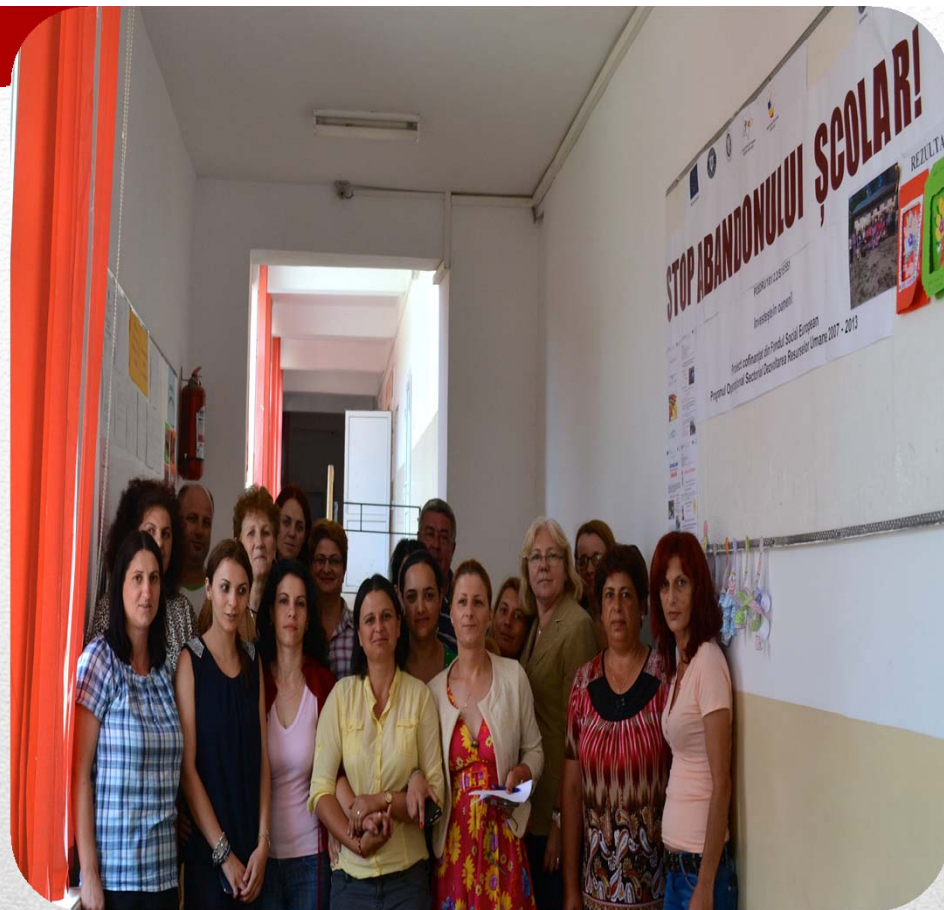
Școala Gimnazială Sadova