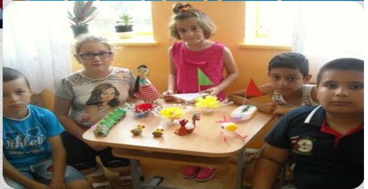
Activități de tip “Școala de vară”