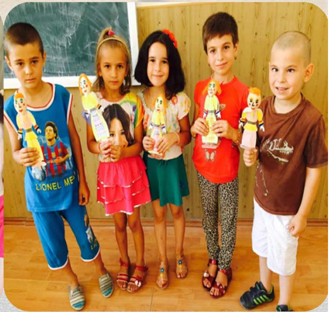
Activități de tip “Școala de vară”