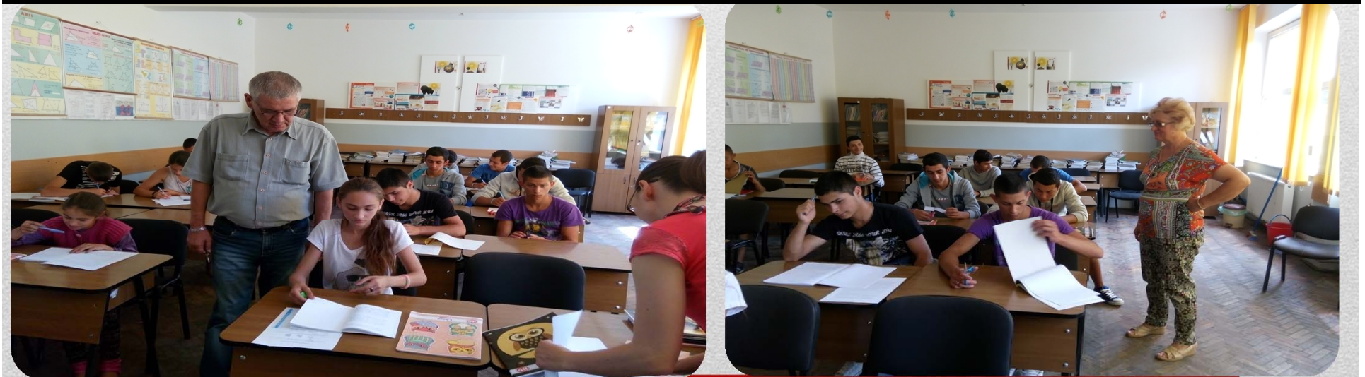
Activități de tip A doua șansă”