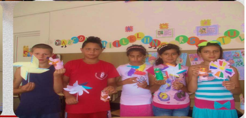
Activități de tip “Școala de vară”