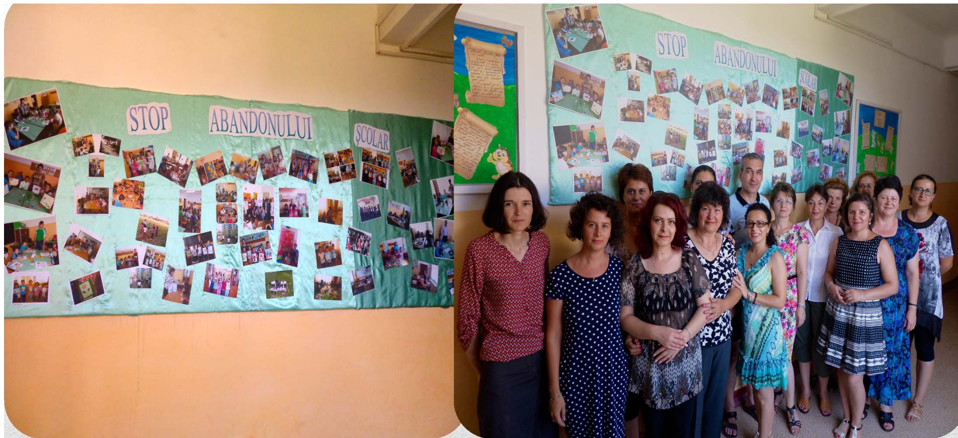
Școala Gimnazială Filiași