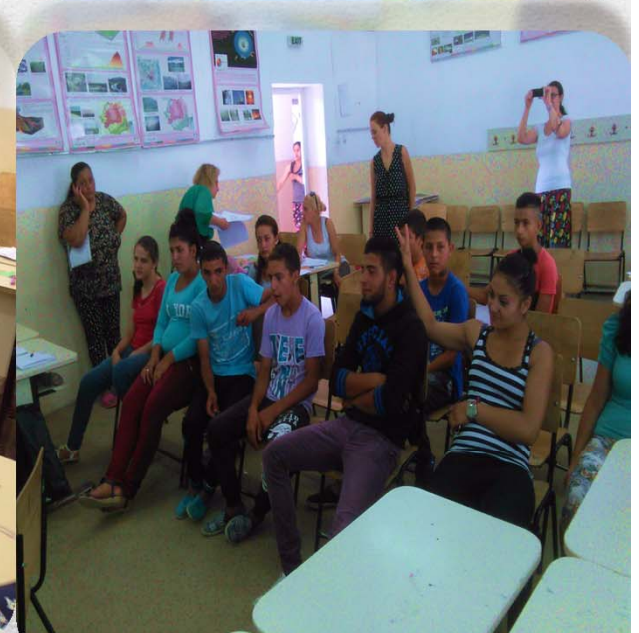
Activități de tip “A doua șansă”