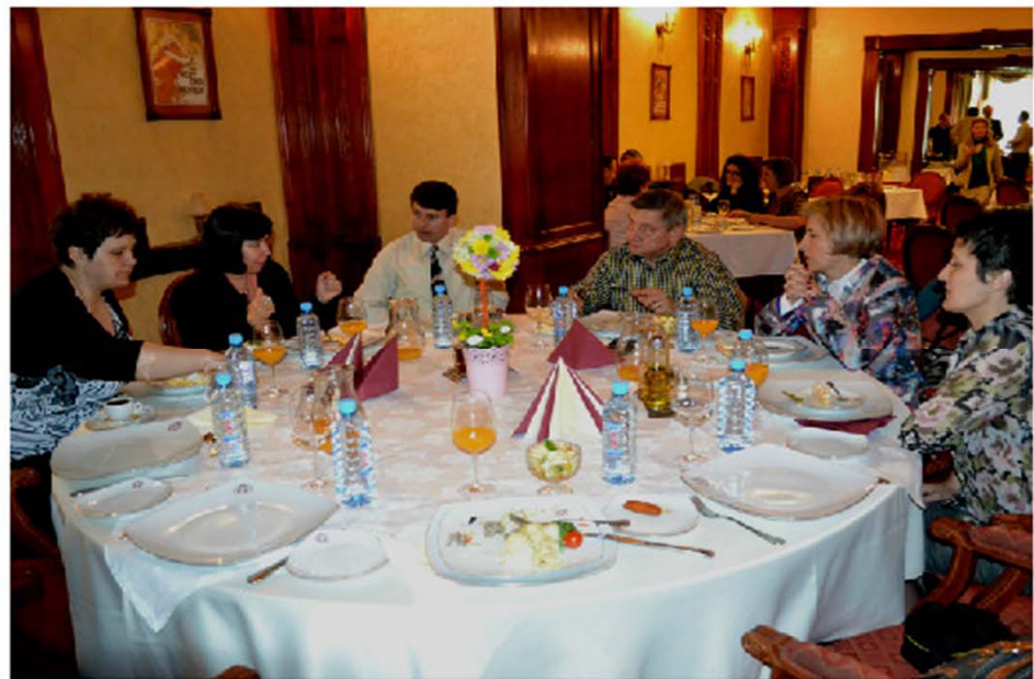
Impresii, interviuri și strategii de lucru după conferința de lansare