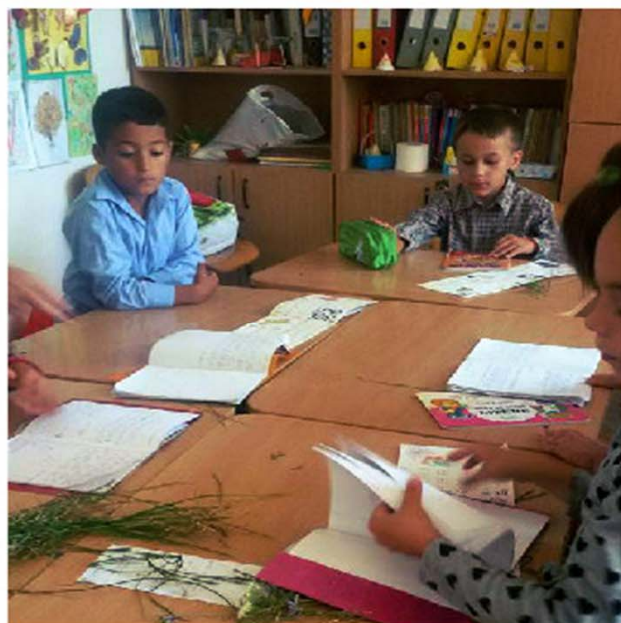
Elevii Școlii Gimnaziale Nr.7 Petroșani concentrați pe realizarea sarcinilor primite