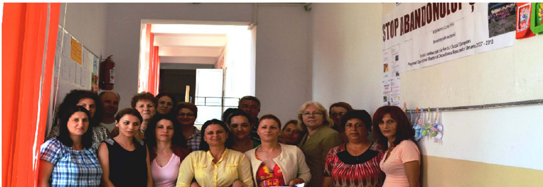
Școala Gimnazială Sadova – experții educativi