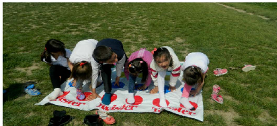
Elevii de la Școala Gimnazială Filiași serioși, conștincioși si bucuroși