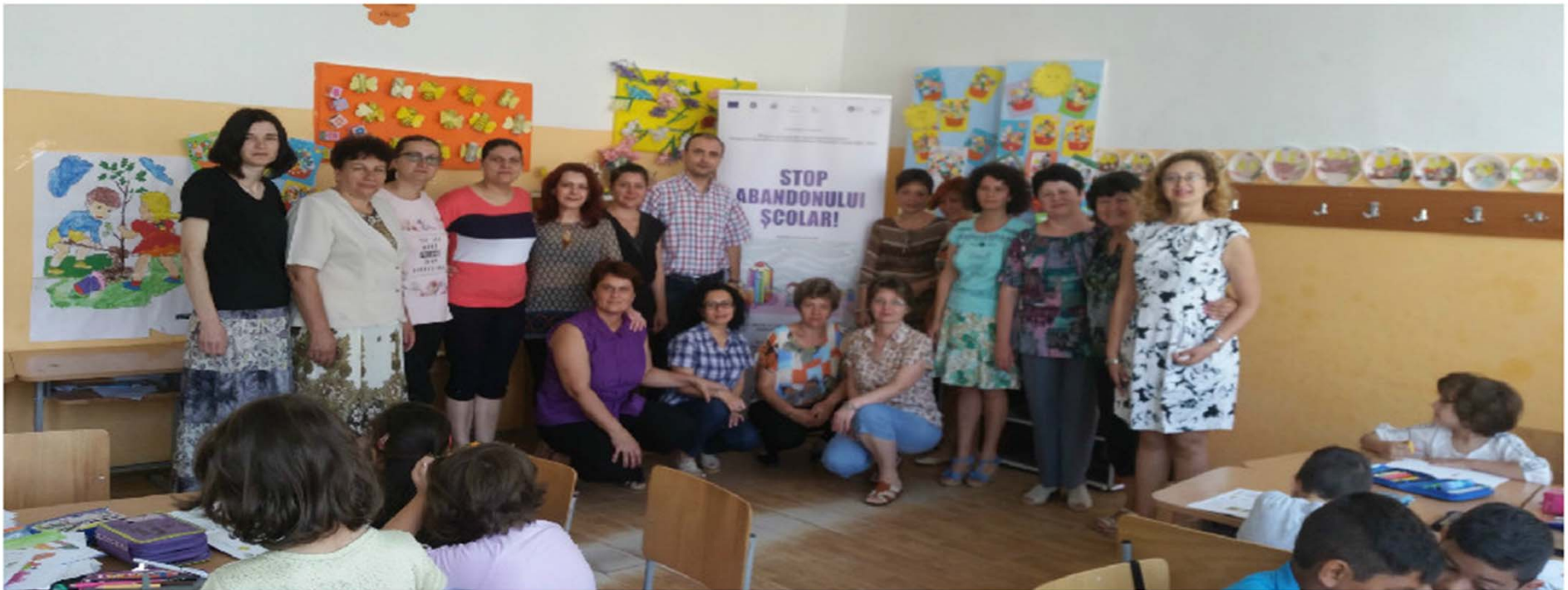
Școala Gimnazială Filași – expertii educativi și coordonatorul de centru