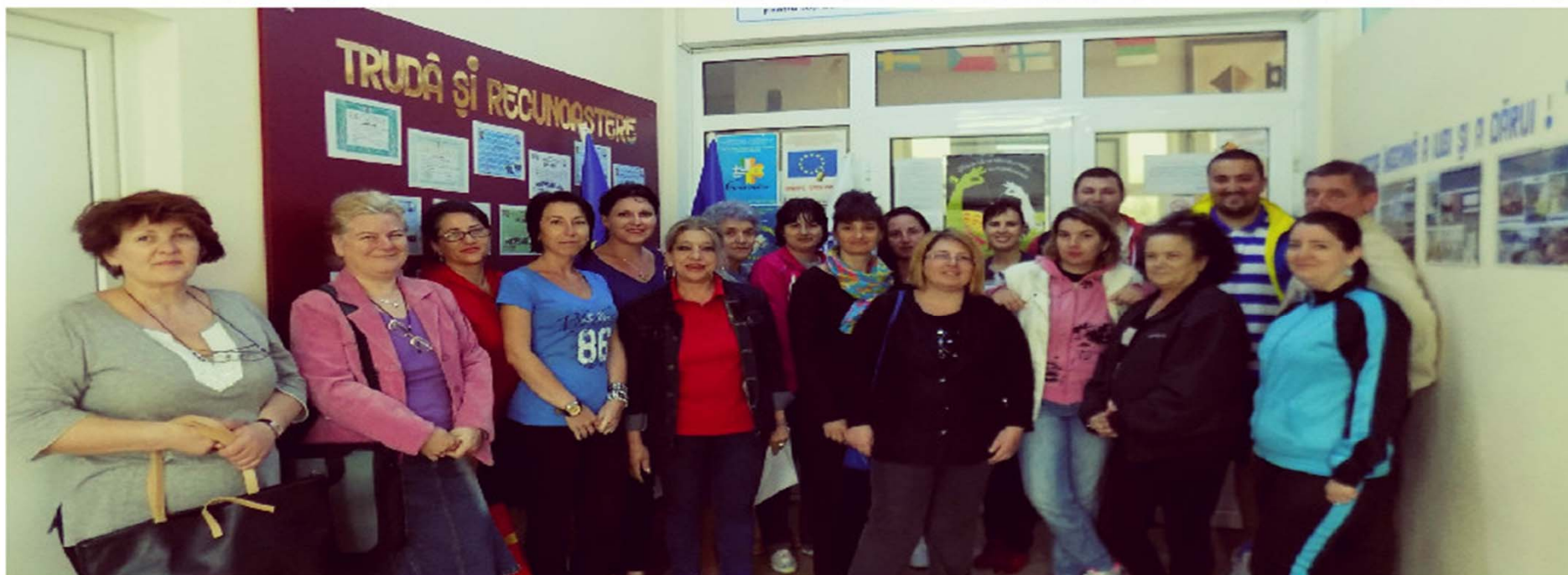
Școala Gimnazială Nr.7 Petroșani – experții educativi