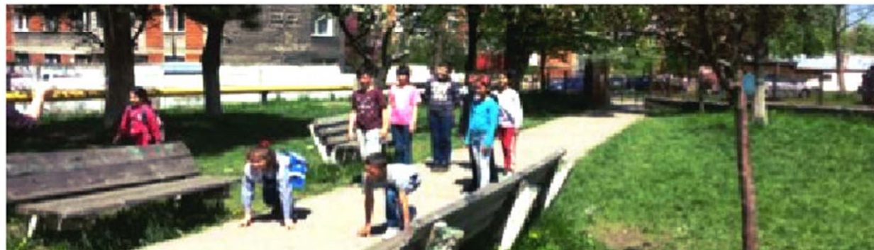
Copiii de la Școala Gimnazială Nr.3 Lupeni intre munca și joc