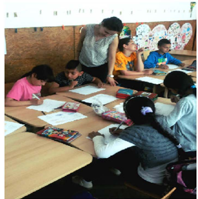
Experții educativi asistă elevii la fiecare activitate desfășurată