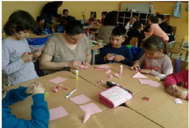
Experții educativi asistând și ajutând elevii la activitățile recreative