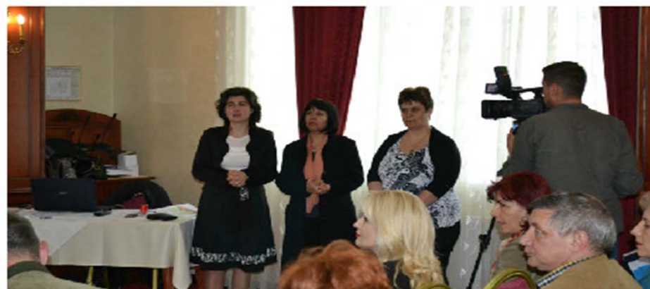
Conferința de lansare a proiectului