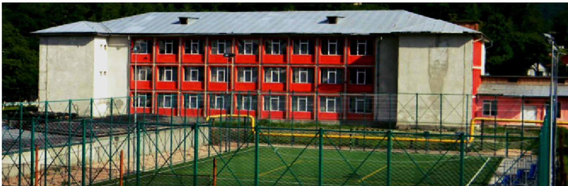
Școala Gimnazială Nr 3 Lupeni