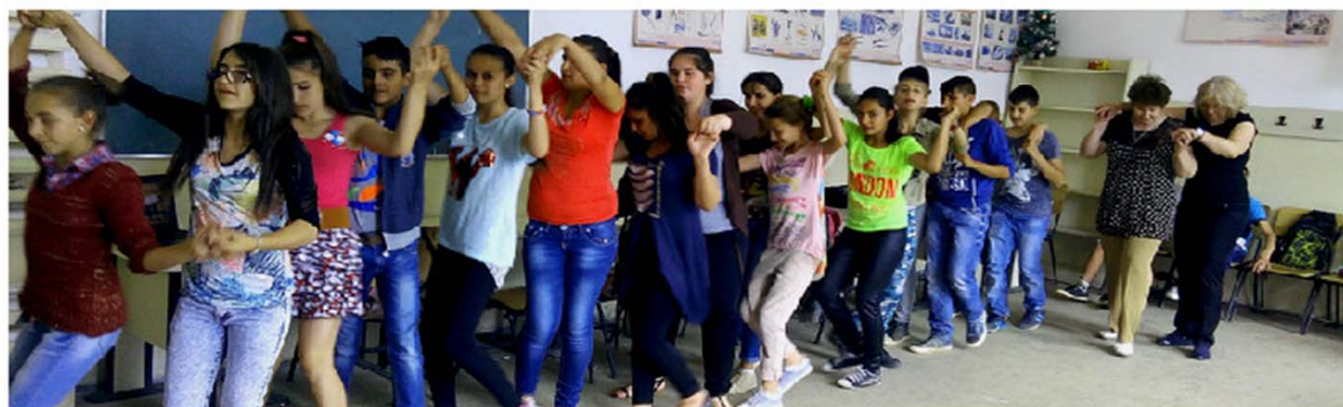
Elevii Școlii Gimnaziale Sadova dezvoltându-si creativitatea și abilitățile de comunicare