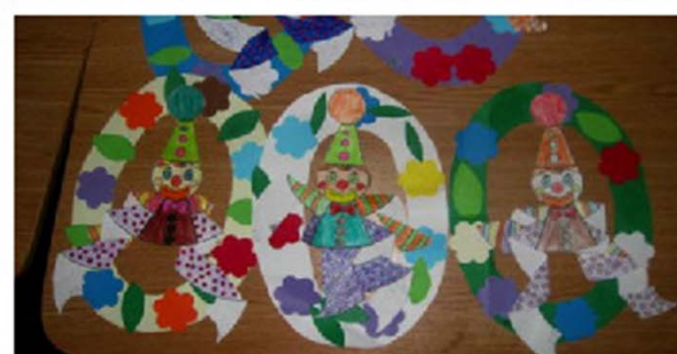
Creațiile pline de viață ale copiilor de la Școala Gimnazială Filiași