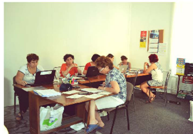
Asociația Edulife – Intreaga echipă la lucru