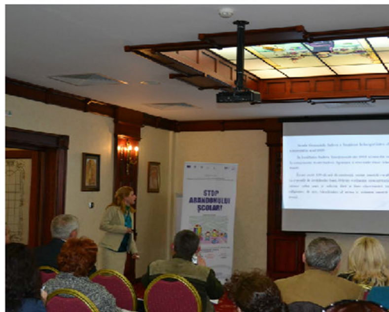
Reprezentanții școlilor partenere prezentând propriile instituții în cadrul conferinței de lansare