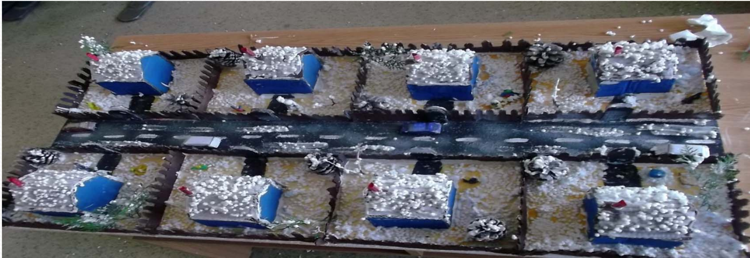
Case construite de meseriasii din comunitate